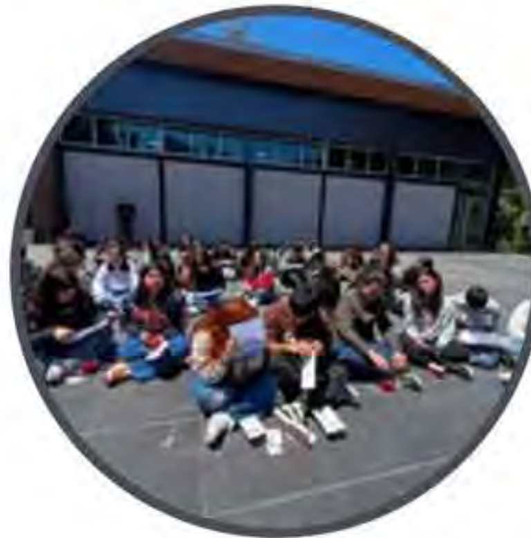
Jornada Cursos y de Padres