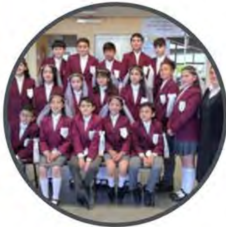
Primera Comunión - Confirmación

formación en valores y el compromiso social